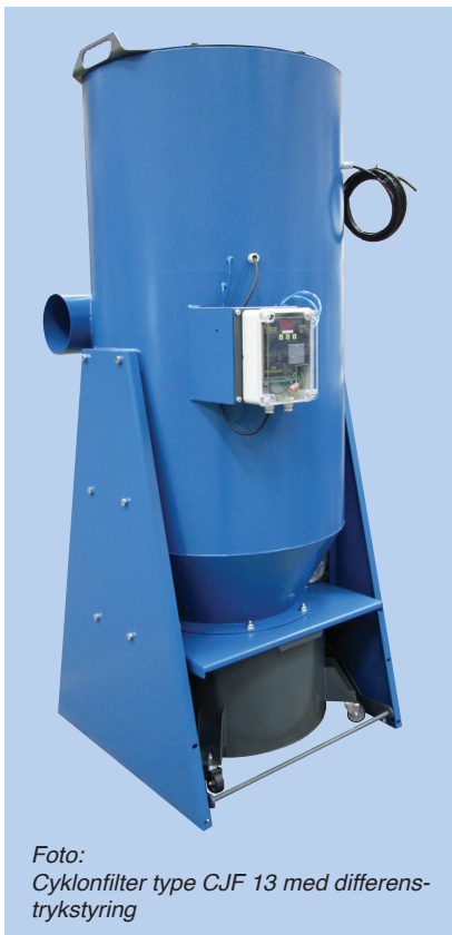
Foto: Cyklonfilter type CJF 13 med differens- trykstyring

Filterhuset er opbygget i 2mm sort stålplade Overflade pulverlakeret RAL 5007/7011 struktur