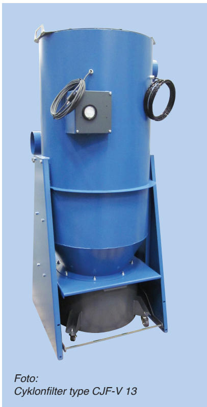
Foto: Cyklonfilter type CJF-V 13