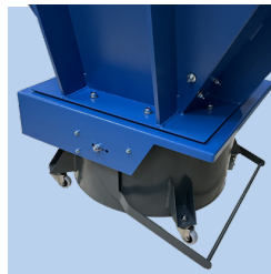
Udmadning i 70L eller 148L spand, samt cellesluse til big-bag