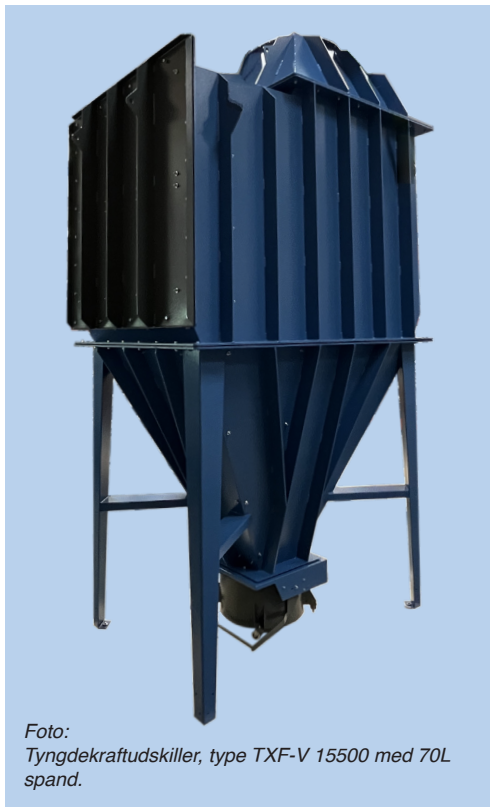
Foto: Tyngdekraftudskiller, type TXF-V 15500 med 70L spand.

For processer med stærkt slidende materialer vil Forudskiller type TXF med fordel kunne indsættes for at reducere slidtage på kanalsystem og centralfilter.