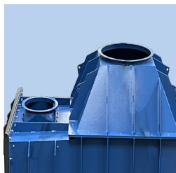
Ind- og udløb i top

Endvidere giver det mulighed at fraseparere tungere/større partikler til genbrug eller sikker bortskaffelse.