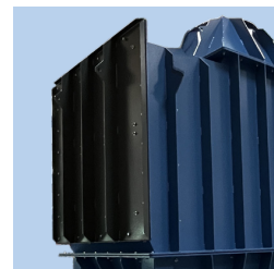
Frontlåde for let adgang til udskiftning af Hardox plader boltet på inderside af råluftkammer